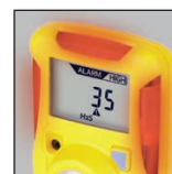
Facile da individuare