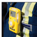
Facile da indossare