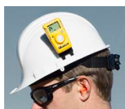
Attacco per elmetto